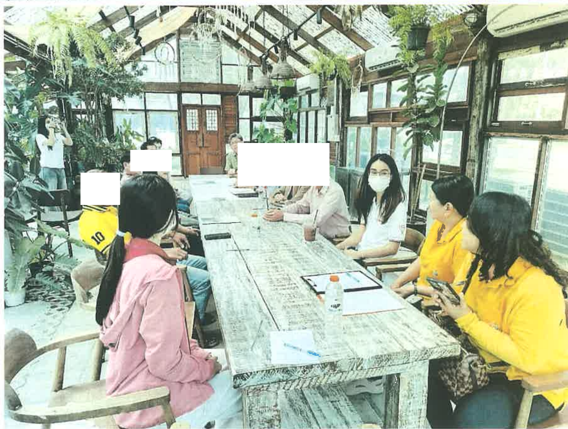
ภาพ : การประชุมปี ๒๕๖๘